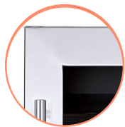
PORTE SANS JOINT