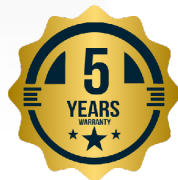
GARANTIE DE 5 ANS SUR LE COMPRESSEUR