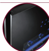
VITRE TEINTÉE SANS CADRE