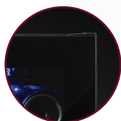
VITRE TEINTÉE SANS CADRE