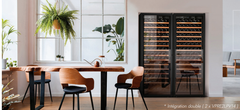
* Intégration double (2 x VPRE2LPV14)