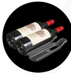
Main du sommelier