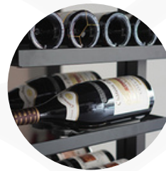
Capacité de 42 bouteilles type bordeaux tradition*